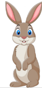
HASEN 4-5 Jährige