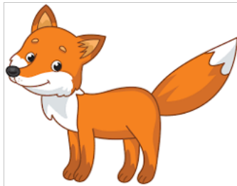
FÜCHSE 5-6 Jährige