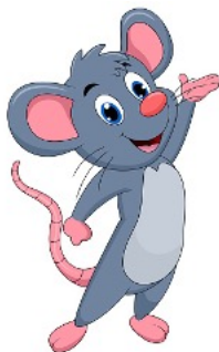
MÄUSE 3-4 Jährige