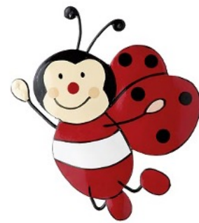
KÄFERLEIN 2-3 Jährige